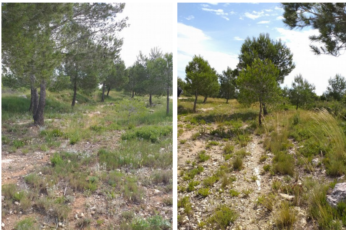
Vistas de la microrreserva en las que se observa el matorral aclarado con presencia dispersa de pino carrasco ( Pinus halepensis ), lugar donde crece el endemismo Sideritis sericea .