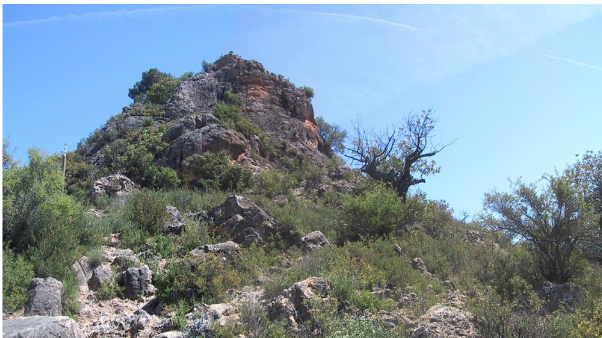
Vista d'una part de la microreserva en la qual s'observa l'hàbitat rupícola 8210.