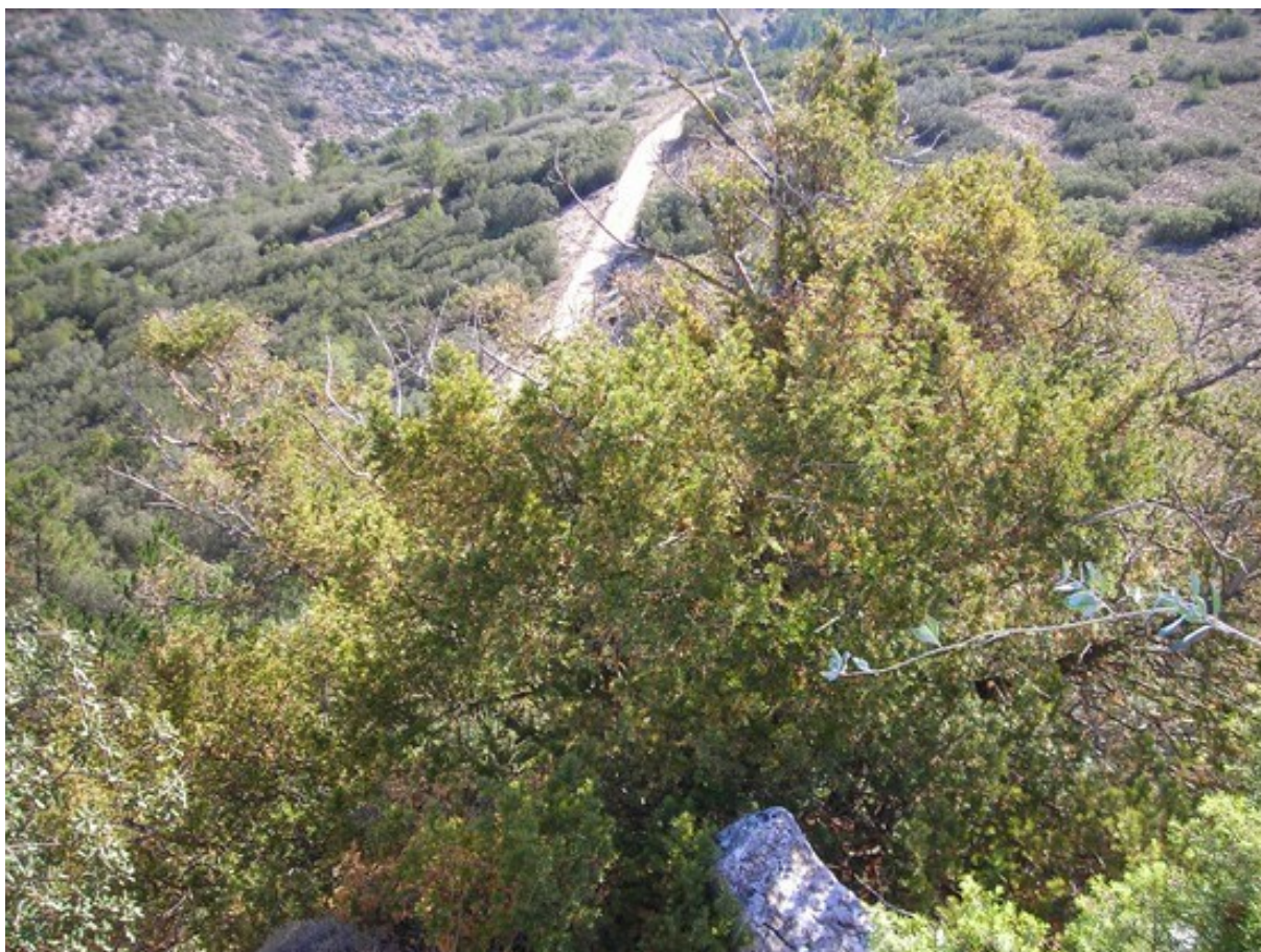
Imatge presa des de la part superior de la microreserva, amb un dels exemplars naturals de teix ( Taxus baccata ) en primer pla, un dels supervivents de l'incendi forestal de 1994.