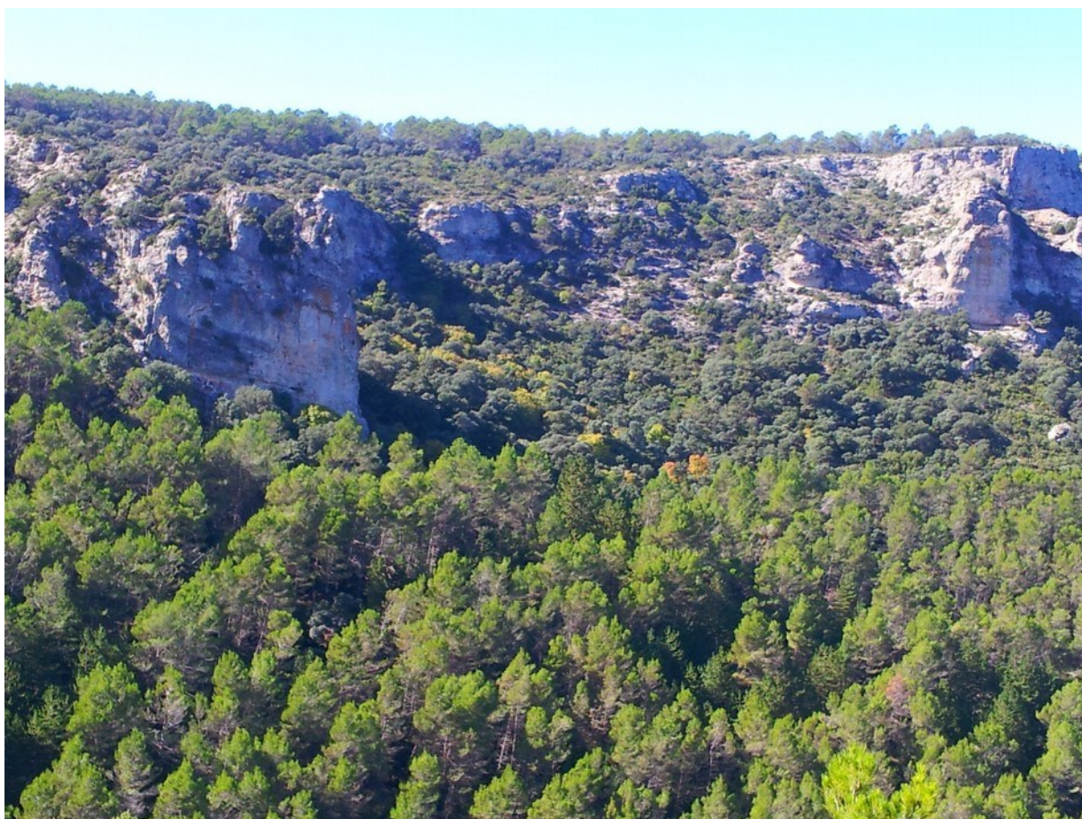
Vista de la microreserva, en la qual s'observen les formacions de pinar de Pinus halepensis i l'hàbitat rupícola.