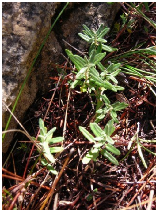
Polygonatum odoratum (esquerra) és una de las plantes rares de la microreserva, mentre que Teucrium pugionifolium (dreta) a més d'endèmica és també una espècie protegida.