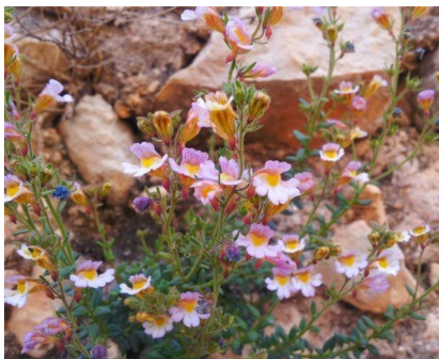
Paronychia suffruticosa (esquerra) i Chaenorhinum crassifolium subsp. crassifolium (dreta) són dos dels endemismes que es poden trobar a la microreserva.

Tipus d'hàbitats (Codi Natura 2000) (Hàbitats prioritaris*)