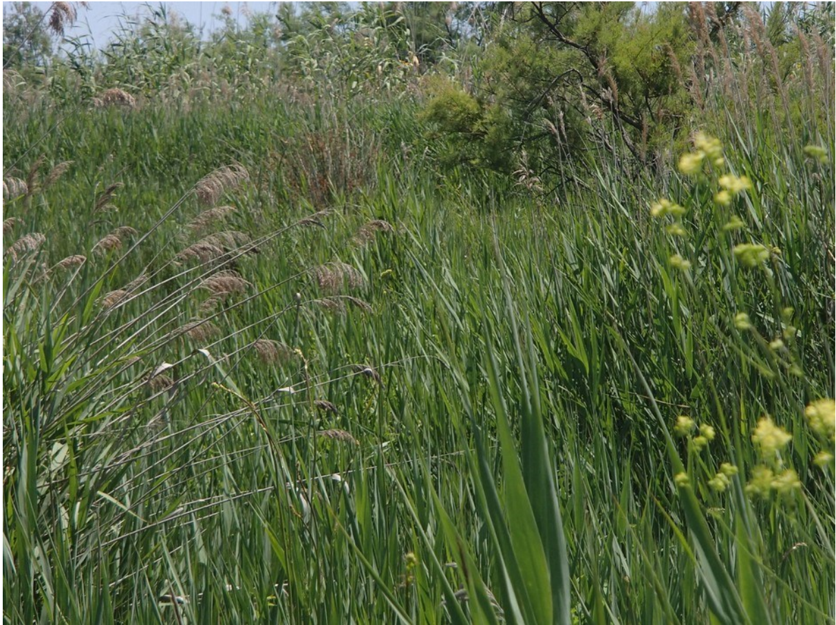
Aspecte de la vegetació de la microreserva, dominada per la comunitat de senill ( Phragmites australis ).