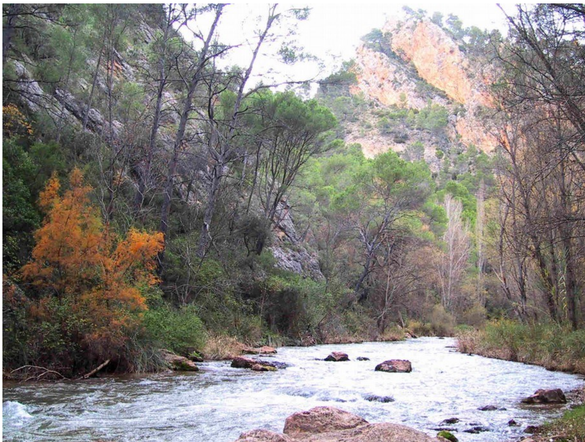
Imatge del riu Túria al seu pas per la Caballera, en la qual s'observen els penyals, hàbitat on creix la corona de rei ( Saxifraga longifolia ).