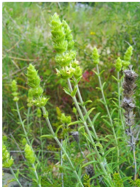
Fumana hispidula (esquerra) i Sideritis tragoriganum subsp. tragoriganum (dreta) són dos dels endemismes presents a la microreserva.

Tipus d'hàbitats (Codi Natura 2000) (Hàbitats prioritaris*)