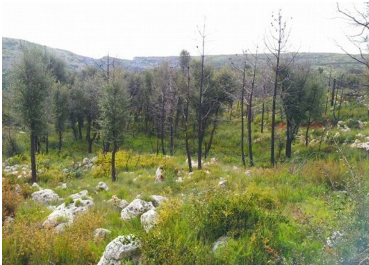
Aspecte de la sureda en recuperació després dels efectes de l'incendi que va patir la microreserva en 2018.