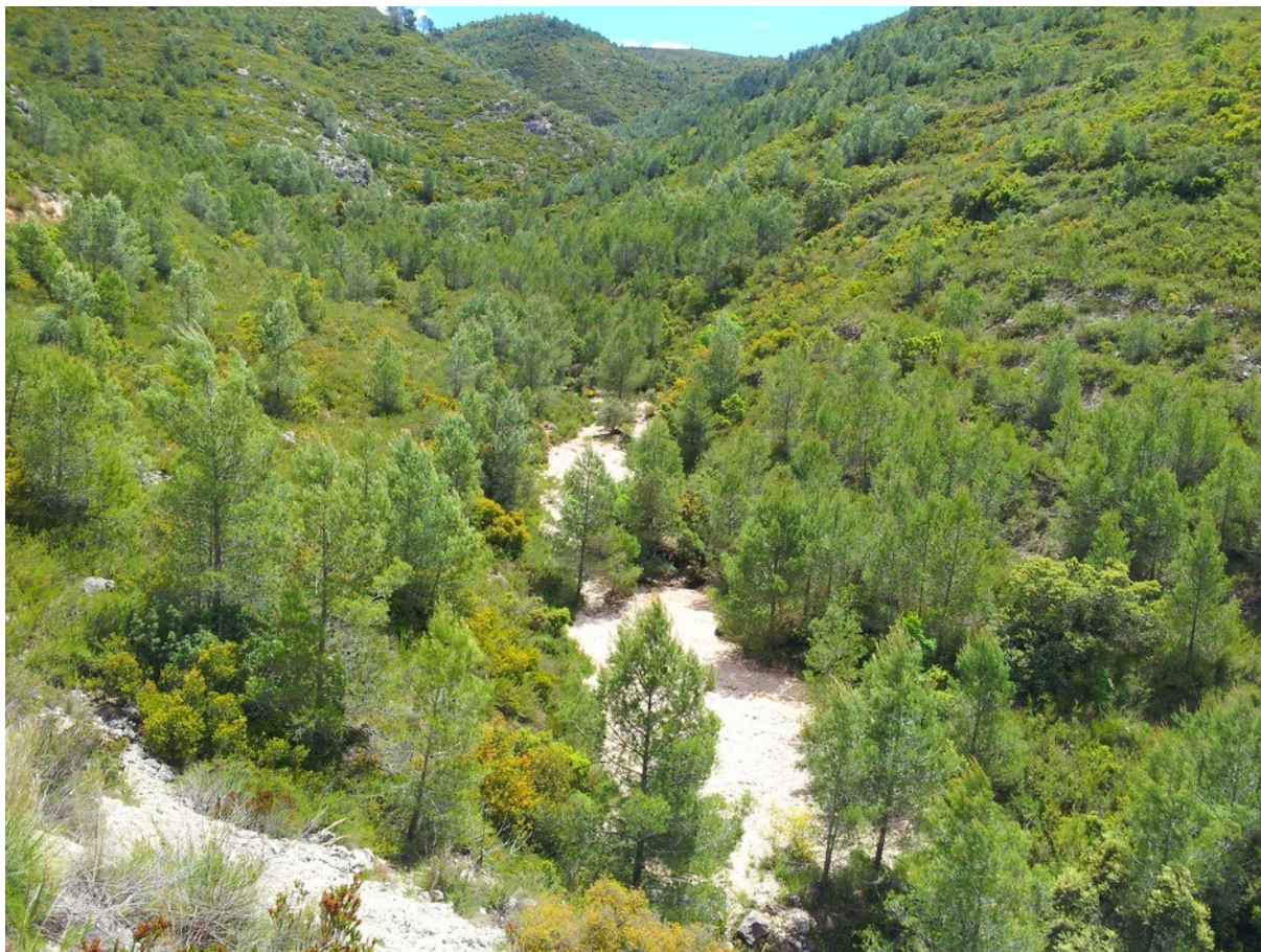
Vista del barranc des de l'extrem nord de la microreserva on es pot apreciar el fons del llit pedregós i els vessants ocupats per l'hàbitat 5330.