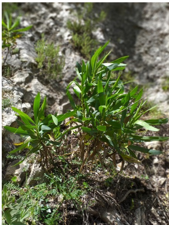
Bupleurum gibraltarium és una planta inclosa en la categoria d'espècies Vigilades .

Muscari atlanticum (R) Odontites recordonii (E) Reseda valentina (E) Rhamnus borgiae (E) Rhamnus lycioides (E) Satureja intricata subsp. gracilis (E) Scrophularia tanacetifolia (E) Sideritis tragoriganum subsp. tragoriganum (E) Teucrium buxifolium subsp. buxifolium (E, R) Teucrium ronnigeri subsp. ronnigeri (E) Thymus piperella (E)