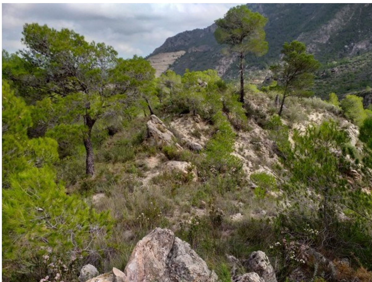
Matorral con ejemplares dispersos de pino carrasco ( Pinus halepensis ) correspondiente al hábitat 5330.

http://www.docv.gva.es/datos/2006/09/11/pdf/2006_10252.pdf