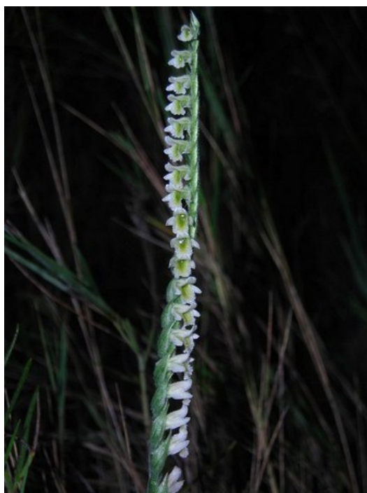
Spiranthes spiralis es una de las orquídeas protegidas que se puede observar en la microrreserva.