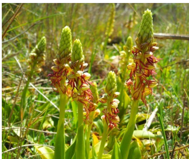
Orchis anthropophora es una orquídea incluida en la categoría de especies Vigiladas.