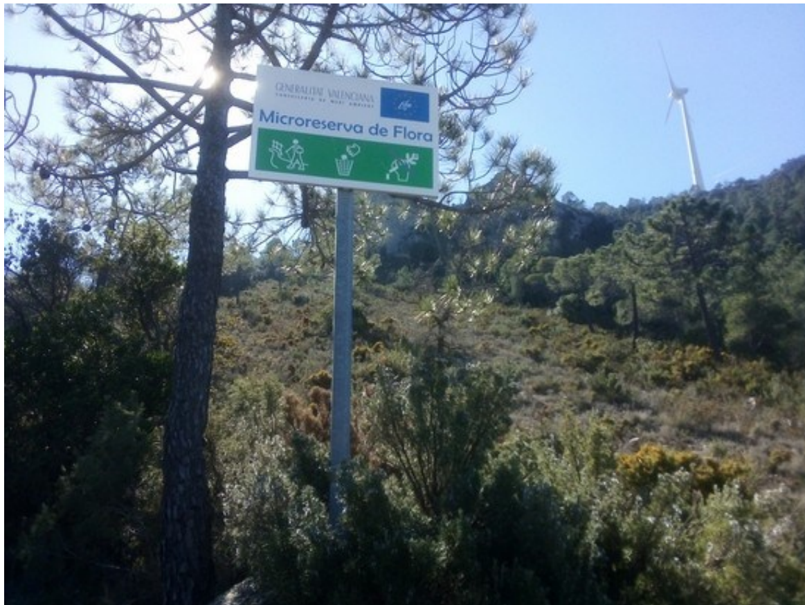
Vista de la microreserva amb cartell en primer plànol i aerogeneradors al fons.