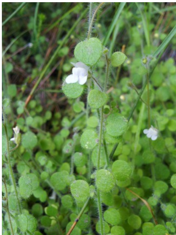
Lonicera splendida (esquerra) i Chaenorhinum tenellum (dreta) són dues espècies protegides que es poden trobar a la microreserva.