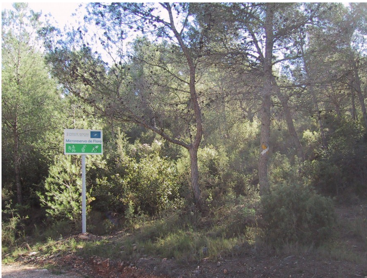
Imatge de la microreserva en la qual s'observa el cartell i el pinar de pi blanc ( Pinus halepensis ).