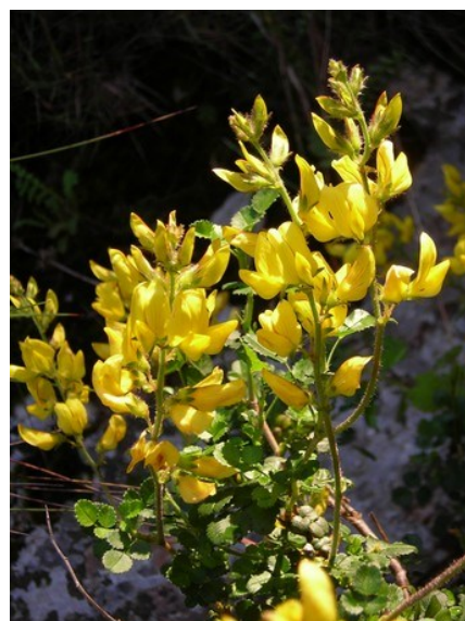
Adonis vernalis (izquierda) y Ononis aragonensis (derecha) son dos especies raras en la flora valenciana que se pueden encontrar fácilmente en la microrreserva.