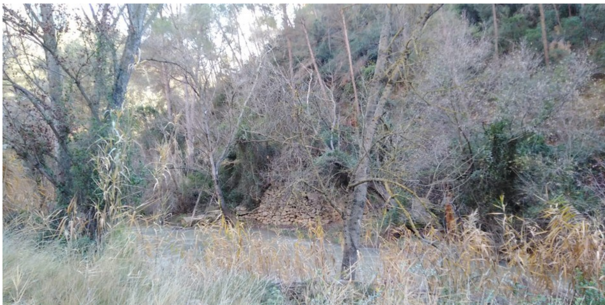
Tram del riu Túria al seu pas per la microreserva en el qual s'observa la vegetació de ribera.