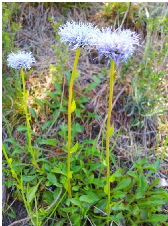
Cytisus heterochrous (izquierda) y Globularia linifolia subsp. linifolia (derecha) son dos endemismos iberolevantinios presentes en la microrreserva.