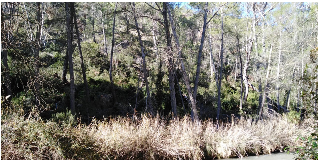
Imagen de la microrreserva en la que se observa el contraste del contacto entre la vegetación de ribera y el pinar con matorral.