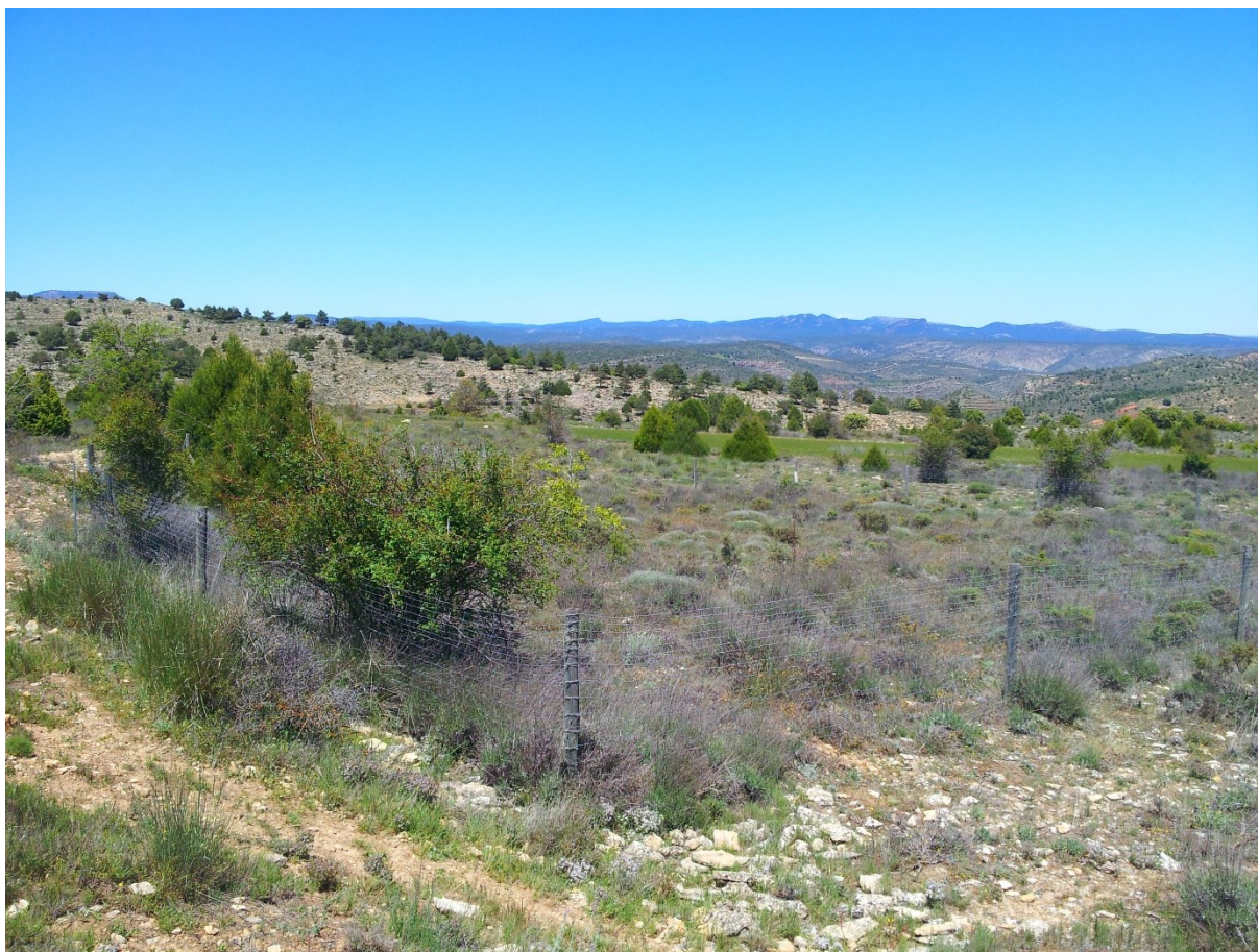
Vista general de la microreserva, en la qual es pot observar la tanca instal·lada per a evitar la caiguda accidental d'algun animal en la cavitat on creix l'espècie Phyllitis scolopendrium .