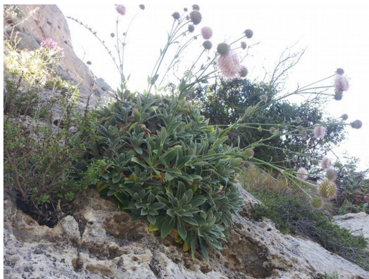
Pseudoscabiosa saxatilis és un endemisme exclusiu d'unes poques comarques litorals valencianes.