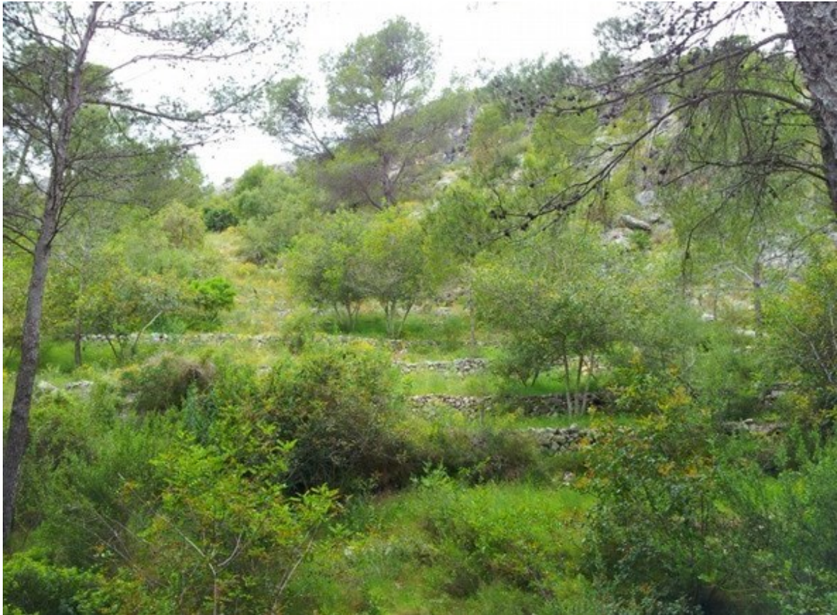
Vessant amb bancals de conreus abandonats on s'han fet actuacions de restauració dels murs de pedra seca.