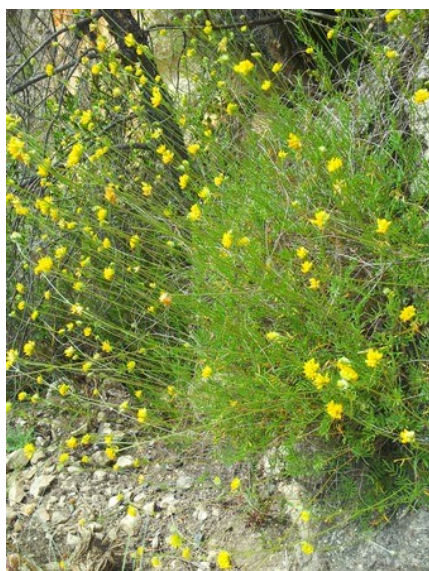
Anthyllis onobrychioides és un endemisme iberolevantí present a la microreserva.