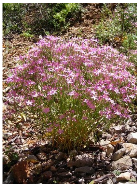
Thymus piperella (esquerra) i Centaureum quadrifolium subsp. barrelieri (dreta) són dos endemismes presents a la microreserva.