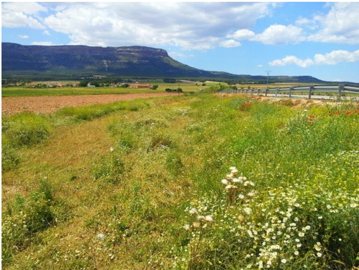
Vista general de la microreserva al costat de la carretera CV-436, amb la serra del Mugrón al fons.

com ara Teucrium campanulatum o altres de molt rares com Potentilla supina . La microreserva queda inclosa completament en la ZEPA Meca-Mugrón-San Benito però només una part de la microreserva es troba dins del LIC Sierra del Mugrón.