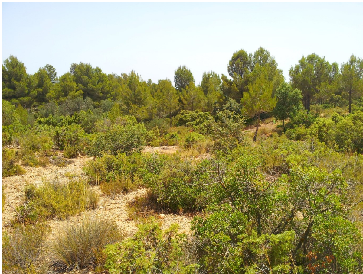
Aspecte de la brolla amb pins blancs ( Pinus halepensis ) dispersos, que és la vegetació que caracteritza aquesta microreserva.