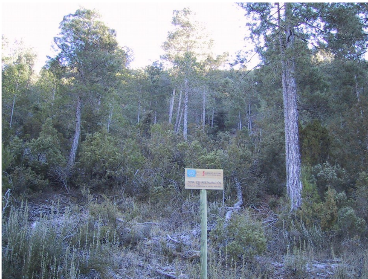
Vista de la microreserva en la qual s'observa el pinar de pinassa ( Pinus nigra subsp. salzmannii ) en una zona on es va fer una plantació l'any 2002.