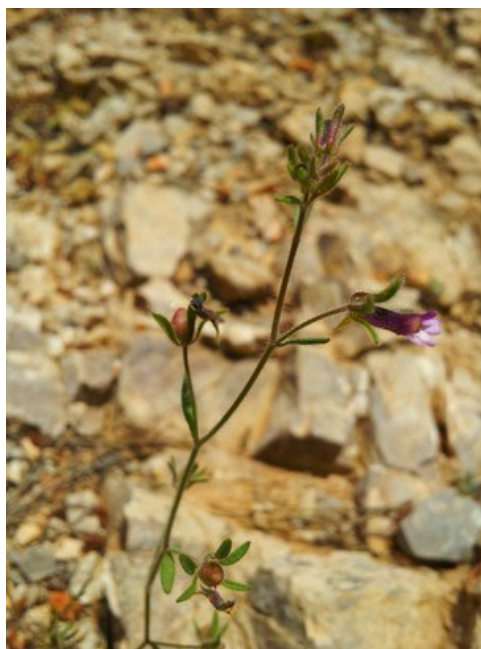
Chaenorhinum rubrifolium és una espècie considerada rara en la flora valenciana.