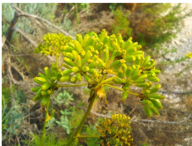
Umbel·la amb fruits de l'espècie protegida Bupleurum gibraltarium , inclosa en la categoria d'espècies Vigilades .