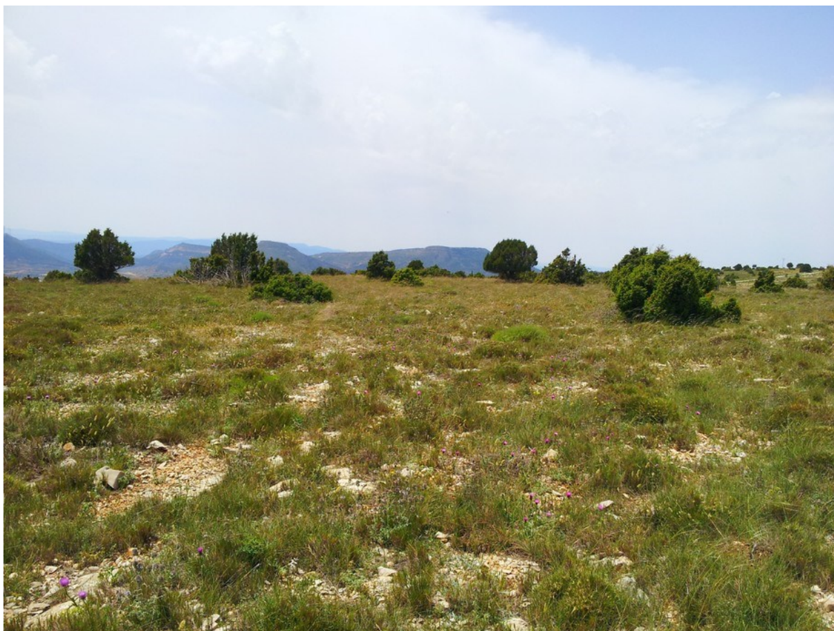
Aspecte de la microreserva amb exemplars de savina turífera ( Juniperus thurifera ) i ginebre ( Juniperus communis subsp. communis ) dispersos i amb les formacions herbàcies que n'ocupen bona part de la superfície.