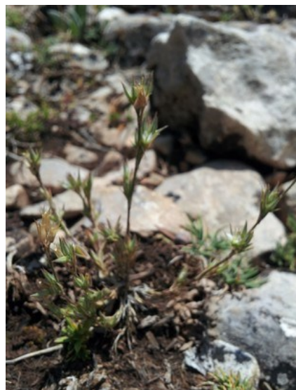
Ononis cristata (esquerra) i Minuartia rubra (dreta) són dues de les espècies característiques dels ambients d'alta muntanya que es poden observar en la zona de l'alto de las Barracas.