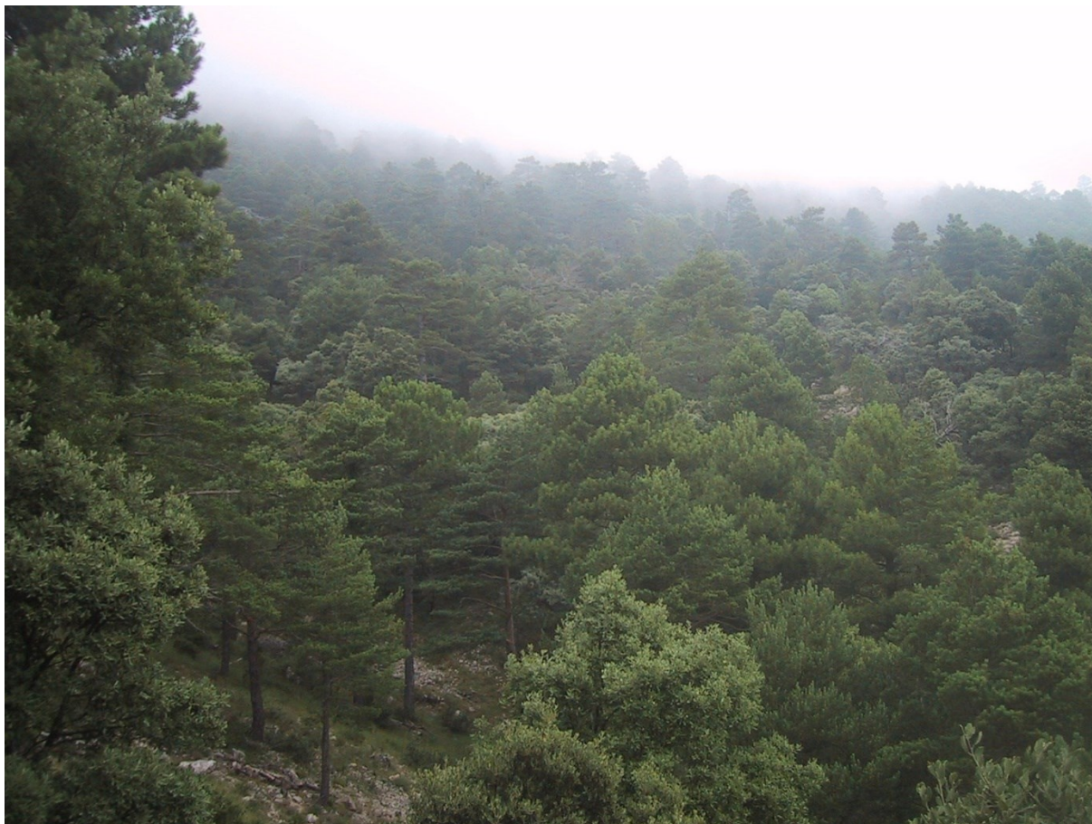
Vista panoràmica de les pinedes de pinassa ( Pinus nigra subsp. salmannii ) de la microreserva.

http://www.docv.gva.es/datos/2003/10/06/pdf/2003_10378.pdf