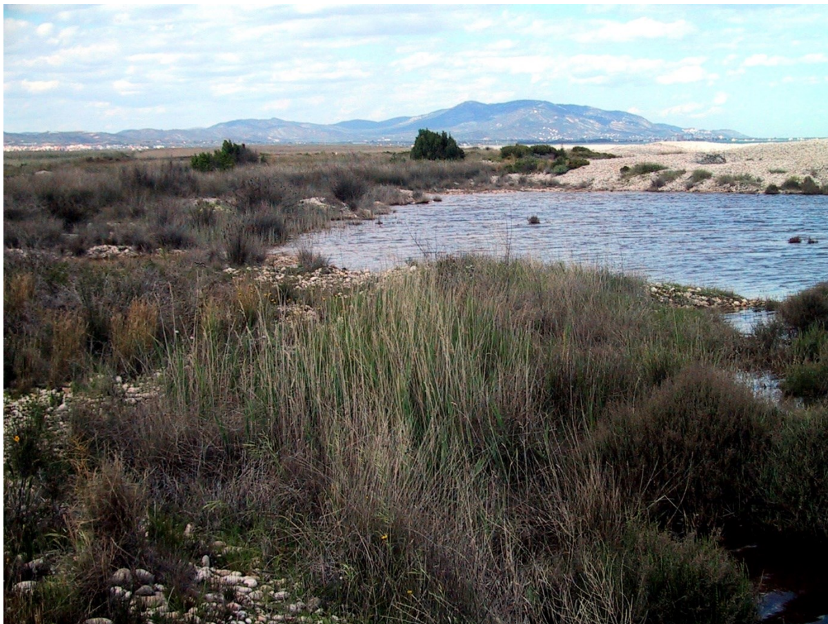
Vista general de la microreserva en la qual s'observa el cordó dunar de còdols i la llacuna temporal.