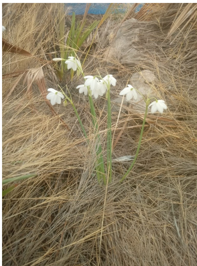
Acis valentina és un endemisme valencià de les muntanyes calcàries litorals.