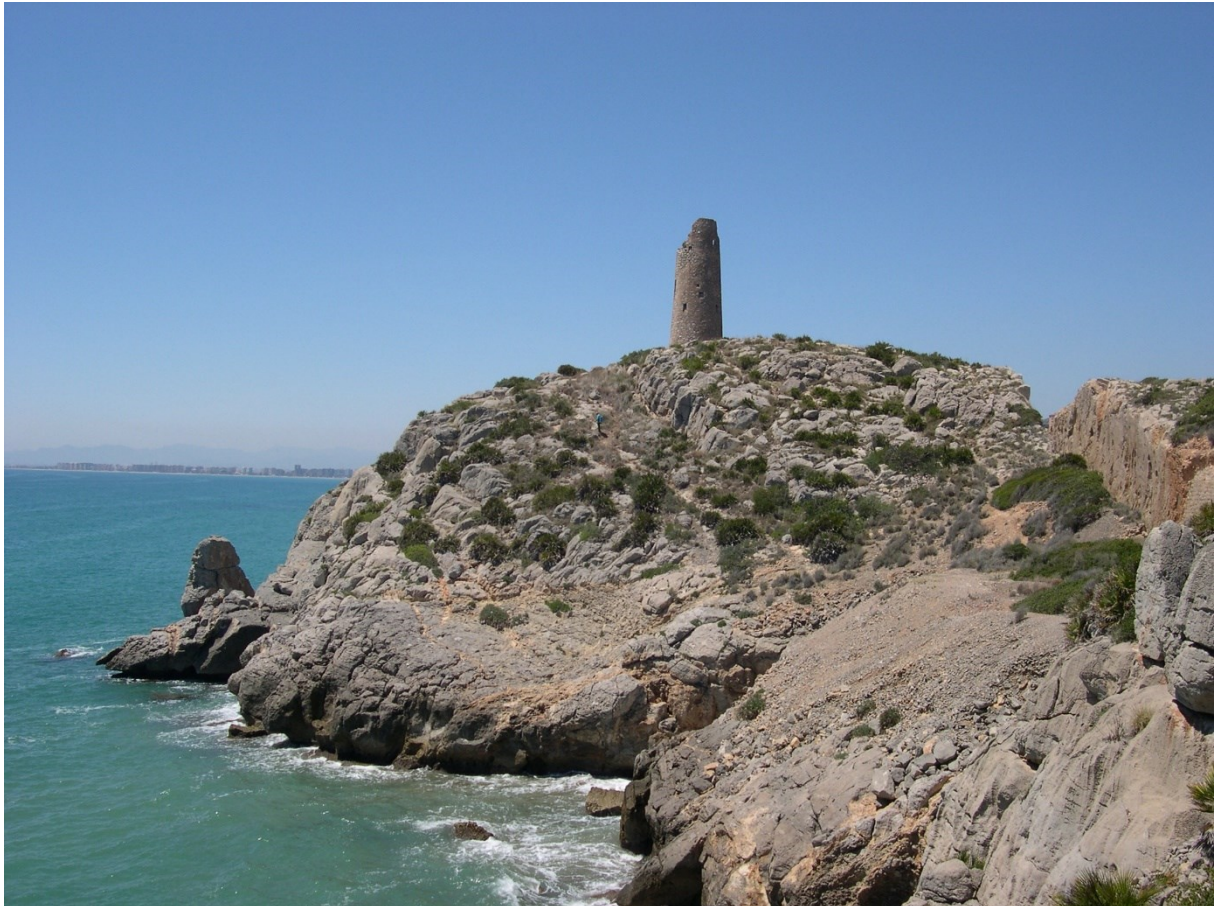
Vista general en la qual s'observa els penya-segats litorals de la microreserva.