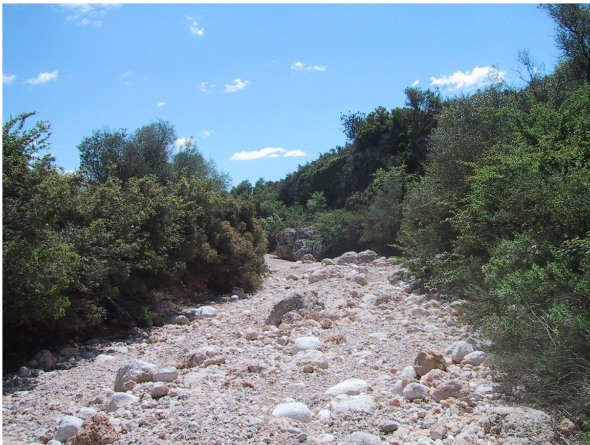
Panorámica del barranco dels Rodejos, donde se encuentra la microrreserva y el Toll Negre.