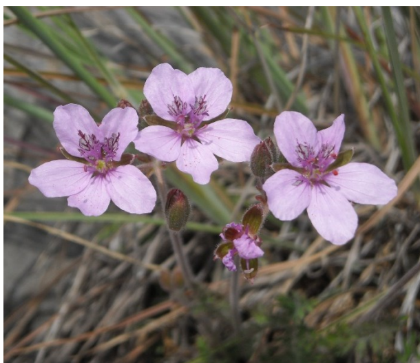
Jasione mansanetiana és una espècie endèmica de l'interior de les províncies de Castelló i València (esquerra). Erodium aguilellae és un endemisme que es distribueix per les serres litorals de la província de Castelló (dreta).