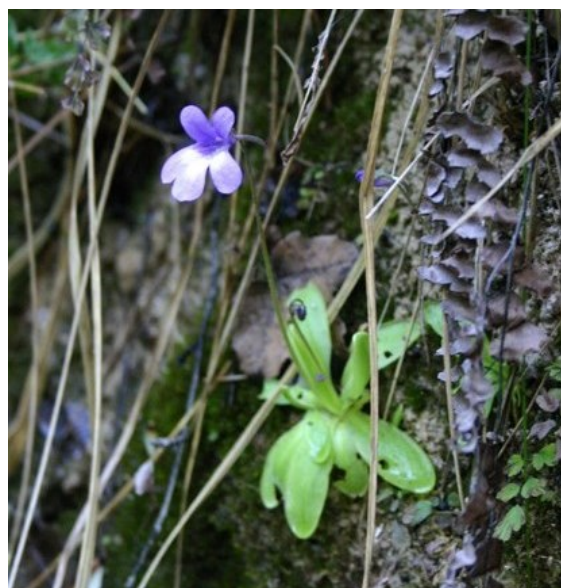
Antirrhinum pertegasii (esquerra), endemisme de l'est de la Península Ibèrica, restringit als Ports de Beseit i Tortosa (massís dels Ports) en la confluència de les províncies de Castelló, Tarragona i Terol. Pinguicula dertosensis (dreta), espècie insectívora, és un endemisme iberollevantí que té l'única representació valenciana a la Tinença de Benifassà.