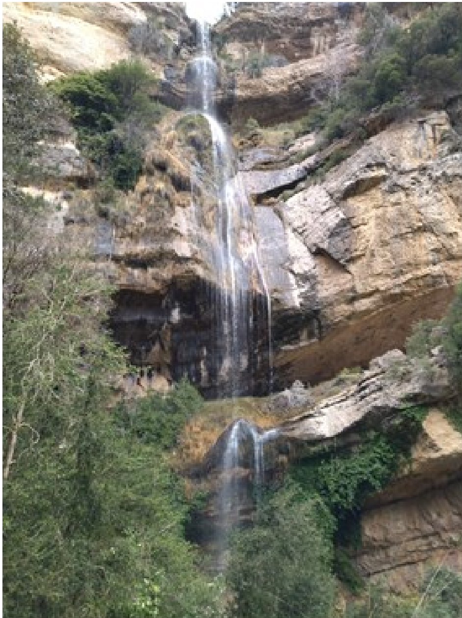
Vista del salt d'aigua que dona nom a la microreserva.

http://www.docv.gva.es/datos/1998/12/02/pdf/1998_10292.pdf