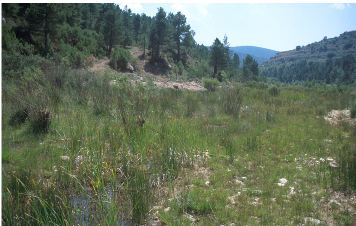
La alternancia de prados húmedos y secos, característicos de la rambla de les Truites, son hábitats óptimos para albergar una notable variedad de orquídeas.