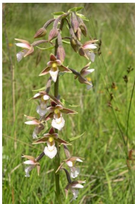
Apium repens (izquierda) coloniza herbazales húmedos poco alterados. Epipactis palustris (derecha) es una orquídea que vive en suelos permanentemente encharcados.