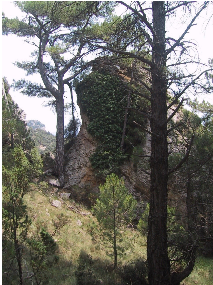
Dos dels hàbitats característics de la microreserva: les pinedes de pinassa i la vegetació rupícola amb Salix tarraconensis .

http://www.docv.gva.es/datos/1998/12/02/pdf/1998_10292.pdf