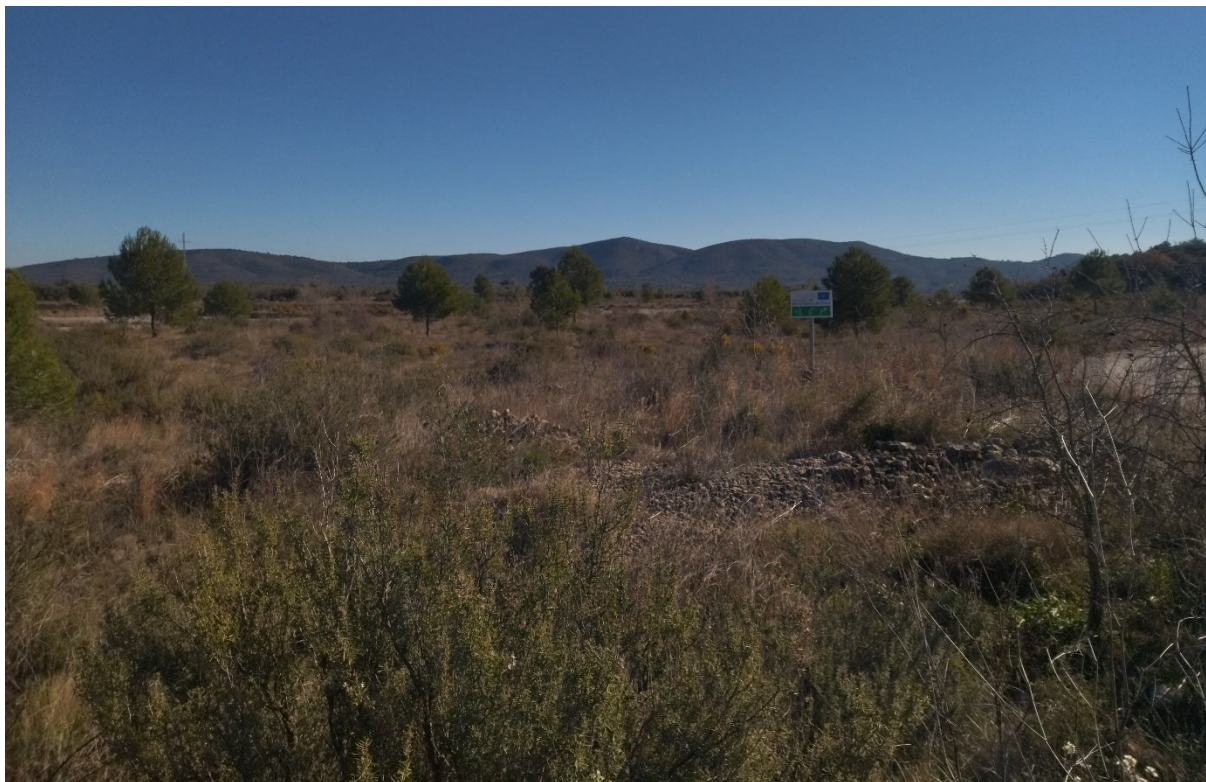
Aspecto general de la rambla.

http://www.docv.gva.es/datos/2003/03/11/pdf/2003_2830.pdf