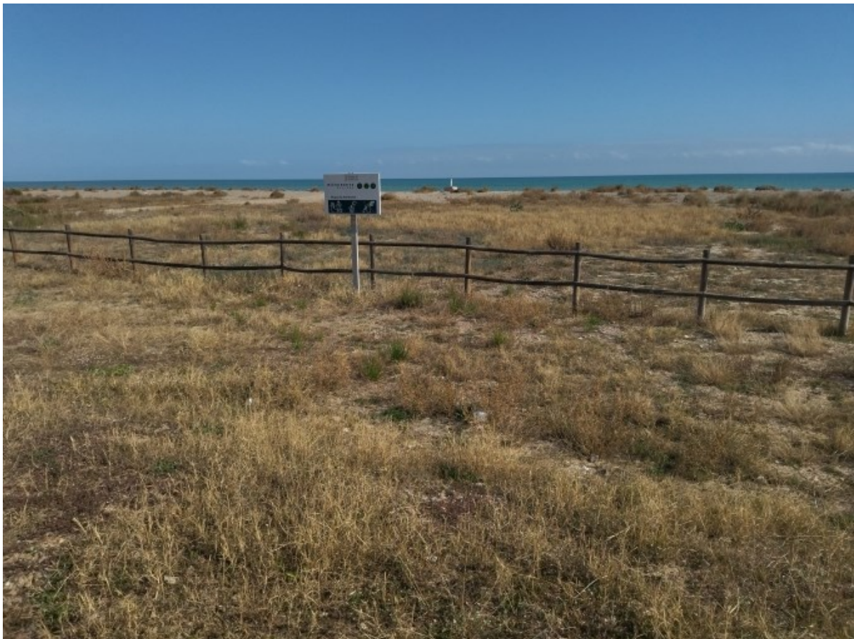
Panoràmica de la microreserva.

http://www.docv.gva.es/datos/2003/03/11/pdf/2003_2830.pdf