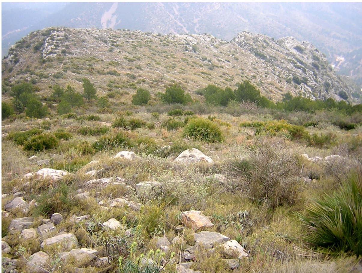
Los pastizales secos son los hábitats idóneos para el endemismo valenciano Acis valentina .