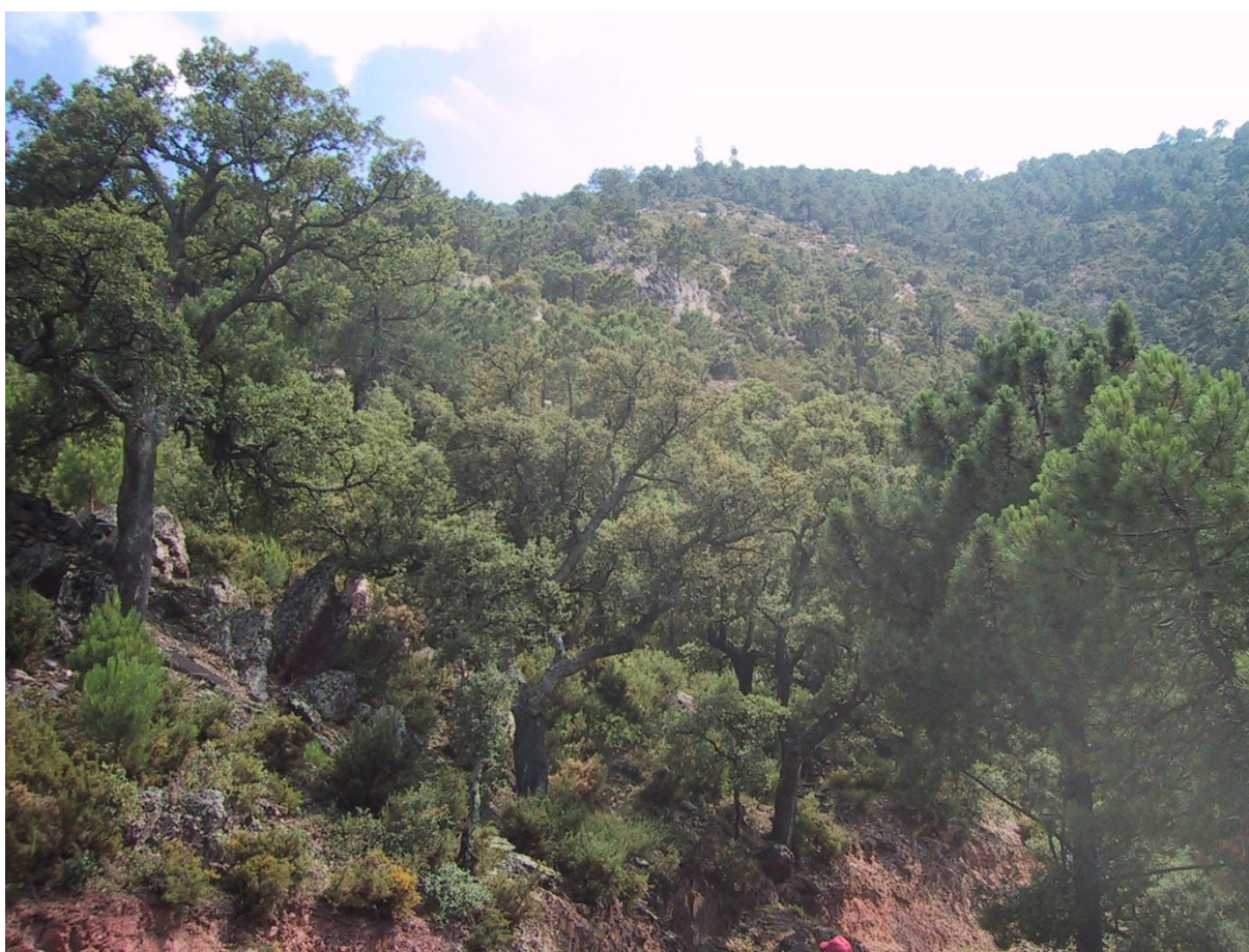
El alcornoque ( Quercus suber ) domina el estrato arbóreo de esta microrreserva.

http://www.docv.gva.es/datos/2001/02/01/pdf/2001_673.pdf