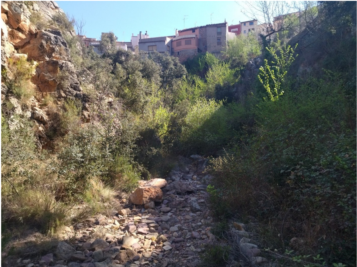
La vegetación de ribera muestra su exuberancia en esta microrreserva.

http://www.docv.gva.es/datos/1998/12/02/pdf/1998_10292.pdf