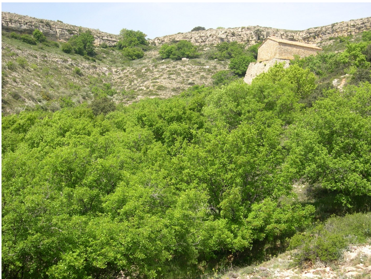
Panoràmica de la microreserva.