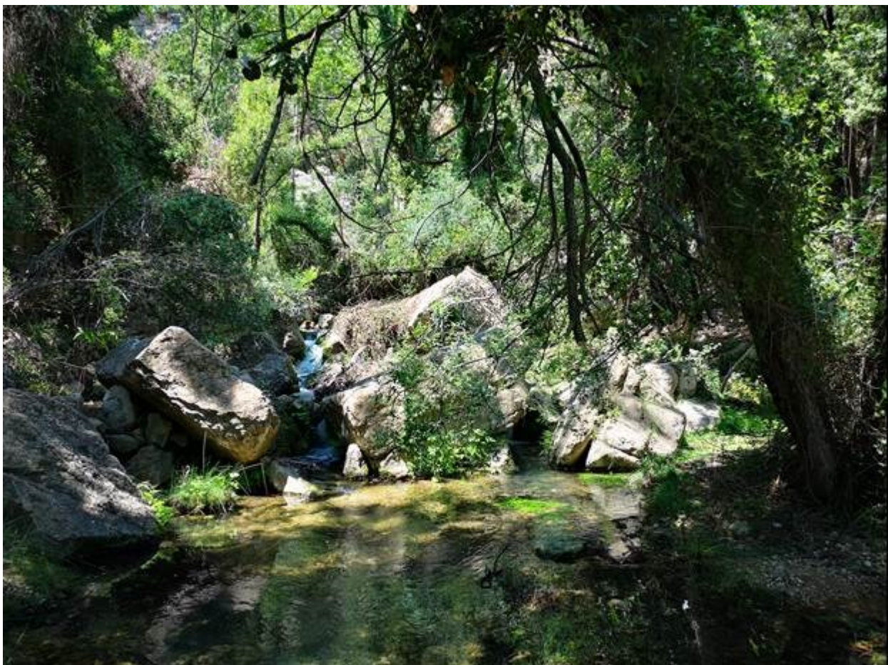
Els ambients humits i ombrívols caracteritzen aquesta microreserva.

http://www.docv.gva.es/datos/2008/04/09/pdf/2008_4091.pdf