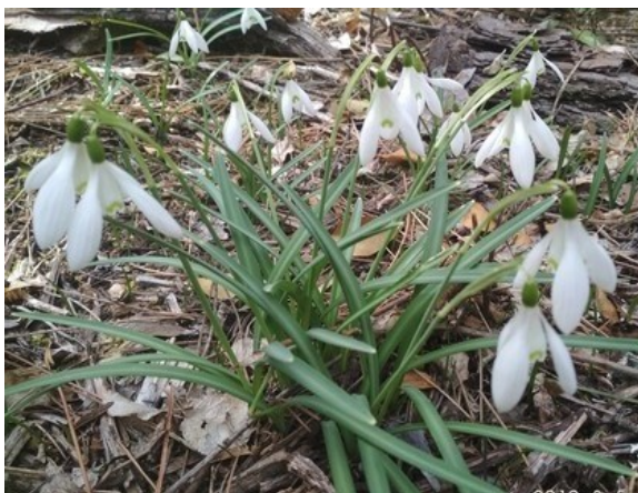
El lirio de nieve ( Galanthus nivalis ) es una especie bulbosa que florece los últimos días de invierno, incluida en el anexo V de la Directiva de Hábitats.