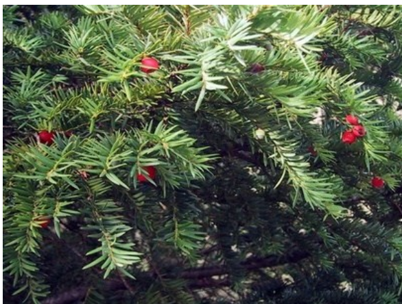
Tejo ( Taxus baccata ), mostrando los frutos con el arilo rojo. El Barranc de la Pegunta cuenta con una población en buen estado de regeneración.