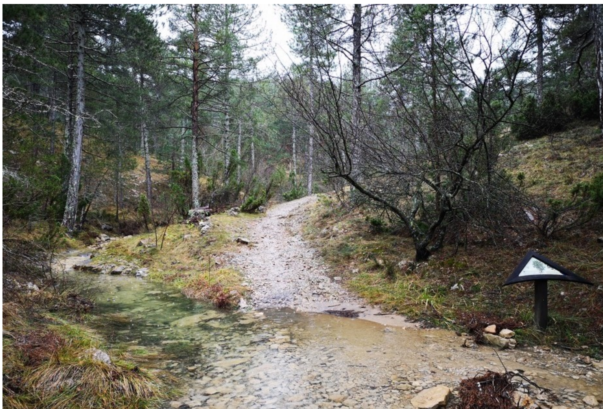
Aspecto invernal del hábitat de pinar negral de la microrreserva con ejemplares de pino albar ( Pinus sylvestris ), enebro ( Juniperus communis ) y uno de los carteles de la senda autoguiada.

http://www.docv.gva.es/datos/1998/12/02/pdf/1998_10292.pdf