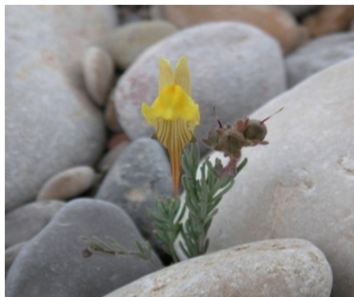
Linaria depauperata subsp. ilergabona , espècie pròpia de llits de rambles i llocs pedregosos calcaris.