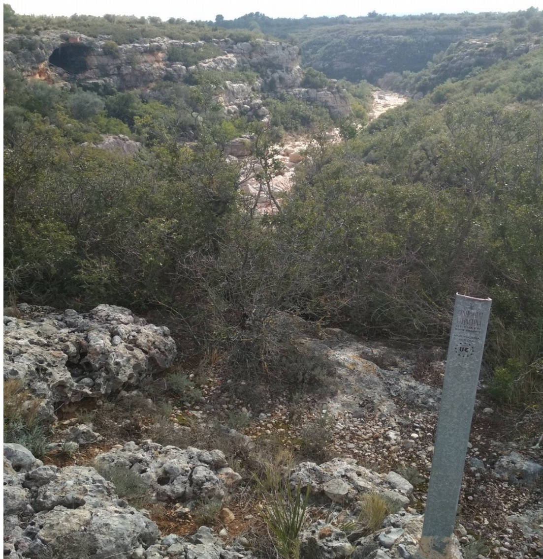
Vista de la microreserva des de la part superior on s'aprecia el caràcter de llit intermitent i els hàbitats més representatius. Els roures d'origen híbrid creixen a les zones més ombrívols.