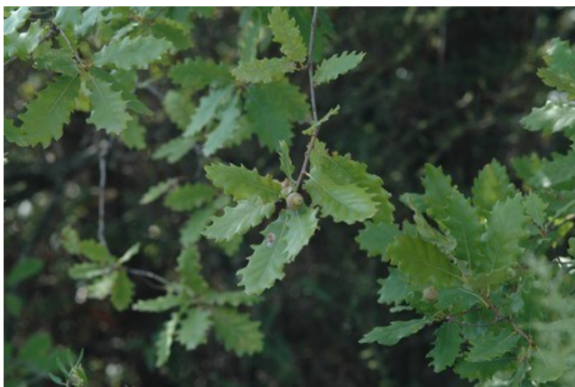
Quercus x coutinhoi , roure d'origen híbrid amb caràcters intermedis entre Quercus robur i Quercus faginea .

Sideritis tragoriganum subsp. tragoriganum (E)