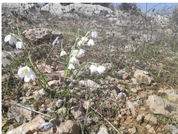
Acis valentina , endemisme iberollevantí de floració tardoral catalogat com a Vulnerable , que creix sobre terrenys rocosos calcaris i compta amb diverses poblacions en la província de Castelló.

Erodium aguilellae (P, E, R) Erodium sanguis-christi (E, R) Guillonea scabra (E) Helianthemum origanifolium subsp. glabratum (E) Rhamnus lycioides (E) Satureja innota (E)