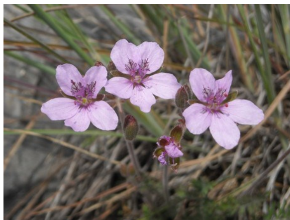
Erodium aguilellae , endemisme de la província de Castelló distribuït per les serres litorals i prelitorals. Forma part de les brolles i prats vivaços sobre sòls calcaris pedregosos.