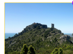
Castell de Montornès