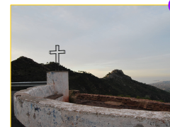
Mirador del castell