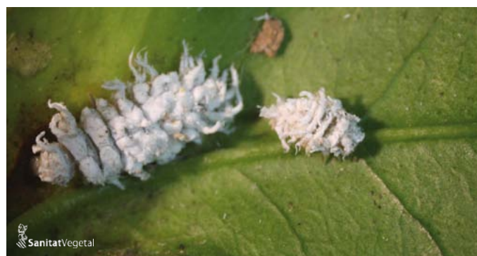
Larves de Cryptolaemus de diferents estadis

El Servei de Sanitat Vegetal posa a la disposició dels agricultors que així ho sol·liciten individus dels enemics naturals criats. Aquells agricultors interessats en l'alliberament d'aquests enemics naturals en les seues parcel·les hauran de sol·licitar-ho. La informació del tràmit i la sol·licitud es pot trobar en: http://www.gva.es/es/inicio/procedimientos?id_proc=15468&version=amp .