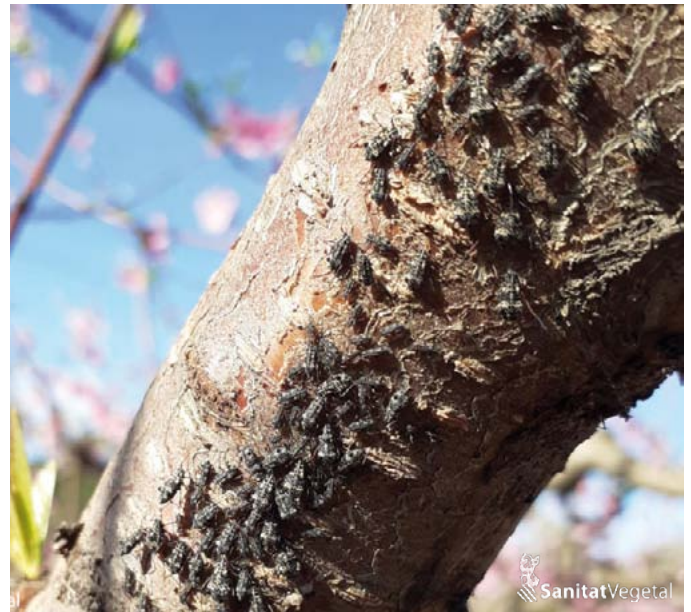
Colònia de Pterochloroides persicae

En el cas de detectar l'atac d'aquesta plaga realitzar el tractament d'hivern adequat per al seu control.