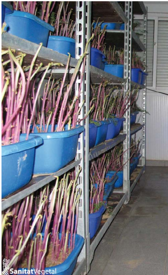
Sala de cria de Cryptolaemus montrouzieri

sol·licitud i la informació del tràmit es pot trobar en: https://www.gva.es/es/inicio/procedimientos?id_proc=21256&version=amp .