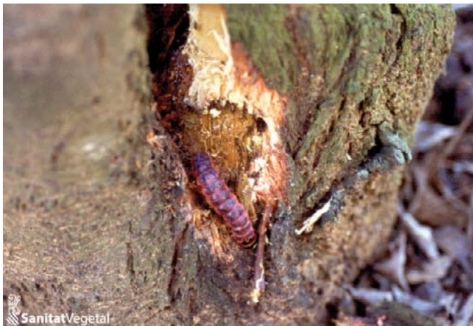
Larva de Cossus en prunera

El control químic és poc eficaç, sent necessari recórrer a mitjans mecànics per al seu control; per tant, una vegada localitzada la galeria, l'anirem descalçant fins a localitzar l'eruga o introduïrem un filferro fins arribar a l'insecte. Posteriorment, una vegada neta, es protegirà la zona lesionada amb un màstic o protector de talls de poda.