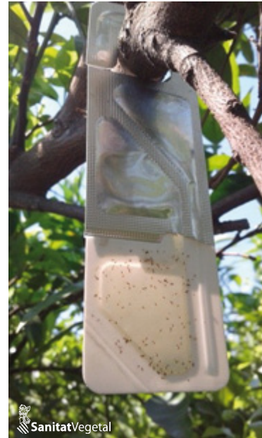
Parany d'atracció i mort amb feromona per al cotonet de Sud-àfrica

A més, s'associa el control d'aquest cotonet, altres depredadors generalistes com ara, Wesmaelius subnebulosus , dípters cecídòmids , Nephus spp. , Crisoperla spp. i Gaeolaelaps aculeifer .