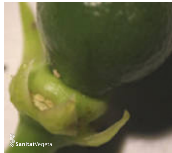
Nimfa de cotonet de Sud-àfrica sobre fruit recentment format

per arbre, en 100 arbres per parcel·la. Triant 25 arbres per cadascun dels costats de la parcel·la. Amb una periodicitat setmanal. El seguiment es realitzarà des de la floració fins que el fruit aconsegueixca 3-4 cm.