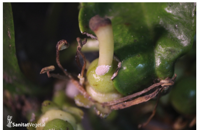
Femella cotonet de Sud-àfrica sobre fruit recentment format

les taronges del grup nàvel o entre fruits en contacte. A partir de la collita, es localitzen generalment en les branquetes i fulles, principalment en fulles prèviament danyades per aranya roja, minador o pugons que provoquen racons on es fixen i refugien. Des del final de l'hivern, és fàcil observar el seu desplaçament pel tronc i branques principals i, també en el sòl. Aquesta característica facilita la identificació dels arbres infestats amb cotonet en aquelles parcel·les afectades recentment i, per tant, serveix per a localitzar els primers focus.