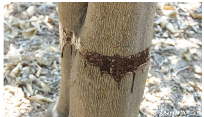
Pasta col·locada en el tronc per a impedir el moviment ascendent de les formigues

Les formigues estableixen relacions mutualistes amb els cotonets, ajuden a la seua propagació i eviten els agents de control. Per a evitar la presència de formigues en la copa, es recomana col·locar barreres físiques, a base de pastes o coles, al voltant del tronc en la seua part baixa a l'eixida de l'hivern. Aquesta acció ha d'estar acompanyada d'una poda que evite que les branques toquen al sòl, per a evitar que les formigues puguen per elles. La duració de les pastes o coles és variable, per la qual cosa s'haurà de renovar quan s'observe que les formigues la traspassen.