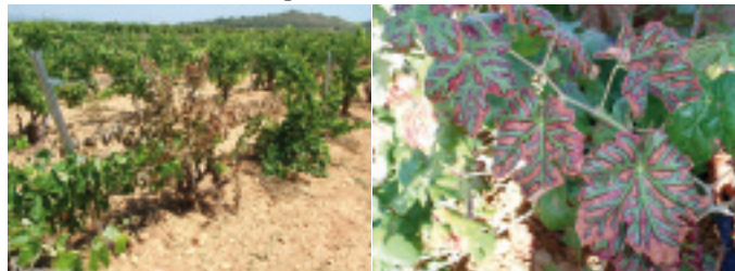
Esca: forma lenta

Informació general: Les malalties fúngiques de la fusta són causades per un complex de fongs patògens, la característica comuna dels quals és que produeixen una alteració interna de la fusta, en forma de podridura seca o necrosi, provocant una reducció del desenvolupament vegetatiu i un decaïment general que, fins i tot, pot acabar amb la mort de la planta.