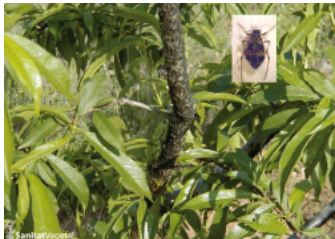
Pugó de les branques ( Pterochloroides persicae )

En el cas de detectar l'atac d'aquesta plaga, realitzar el tractament d'hivern adequat per al seu control.