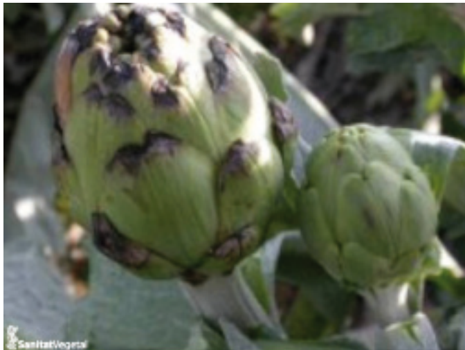
Detall del capítol afectat per A. hortorum

Després de la primera infecció del fong pot sobrevindre una secundària de botrytis , la qual cosa ha de ser tinguda en compte per a eliminar com més prompte millor el material vegetal afectat i disminuir la pressió de l'inòcul, ja que no hi ha registrat cap producte anti botrytis autoritzat per a carxofa.