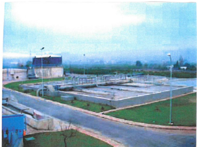
Reactor Biológico Edar Castellón.