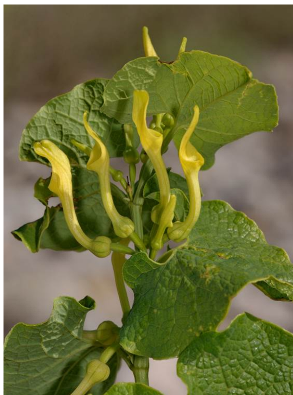
Figura 1. Detalles de las flores de Aristolochis clematitis .

La aristoloquia sarmentosa o aristoloquia común ( Aristolochia clematitis ) es una especie rara en la flora española, solo está citada en la parte este-noreste de la Península Ibérica (Barcelona, Gerona, Castellón) y en las Islas Baleares (Mallorca y Menorca). En la Comunitat Valenciana, sólo se conoce una población natural en las playas pedregosas del Parque Natural del Prat de Cabanes-Torreblanca, dentro de la microrreserva de flora "Platja del Quartell Vell". Esta especie fue catalogada desde un primer momento como "En peligro de extinción" en la Catálogo Valenciano de Especies de Flora Amenazadas (Decreto 70/2009, de 22 de mayo; y Orden 2/2022, de 16 de febrero).