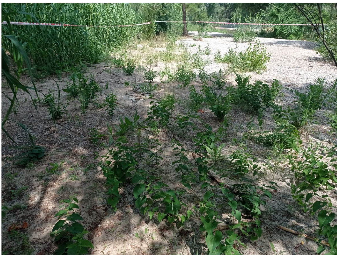
Figura 2. Aspecto de la població creada de Aristolochis clematitis en el Parque Natural del Turia (Vilamarxant), junio de 2022.