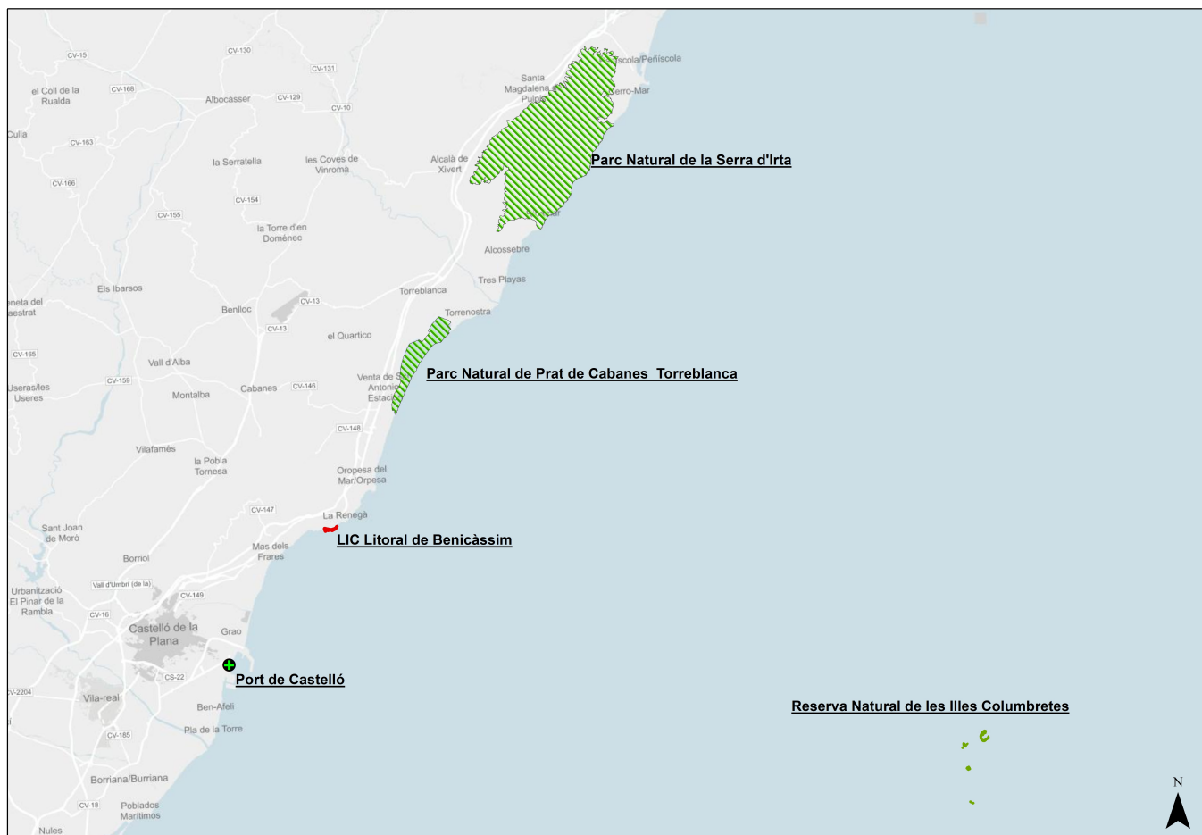
Figura 2. Localización de las poblaciones naturales de Medicago citrina en la provincia de Castellón y espacios susceptibles de acoger repoblaciones.